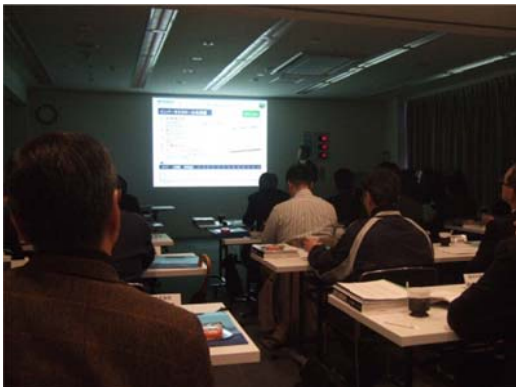
インバータ冷凍機についてのご紹介