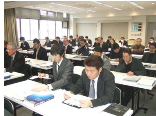
熱心にプレゼンに聴き入る参加者