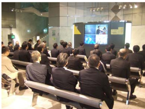
1階フロアでの担当者によるガイダンス