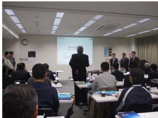
最後に飯島委員長より御礼のご挨拶