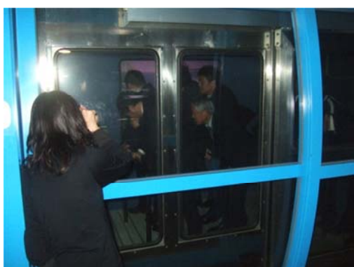
秒速30mの強風体験(メガネを外して!)