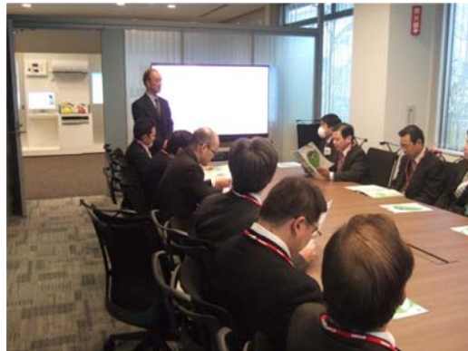
スマートグリッドの取り組みについてご紹介