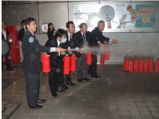
実際に消火器を使用する訓練