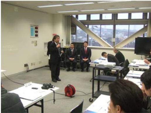
三菱電機照明(株)様会議室でのプレゼン