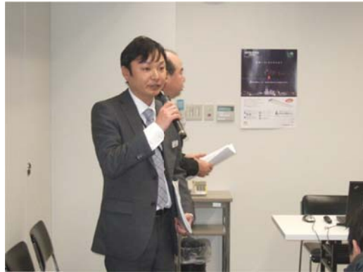
三菱電機照明(株)三野宮様による進行