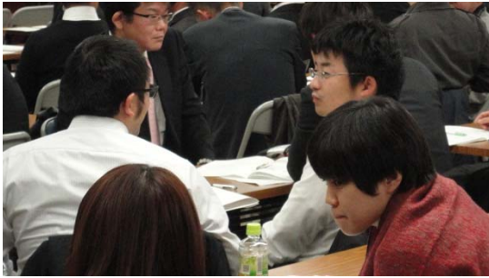
『ポジティブリスニング』のロールプレイング