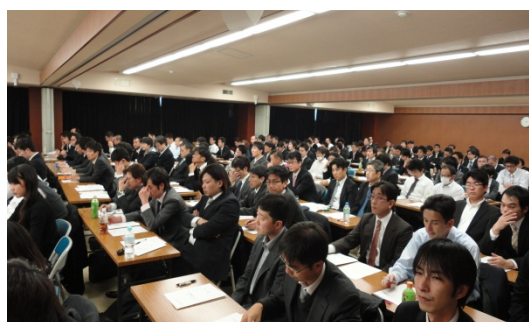
受講者でほぼ満席となった今回のセミナー