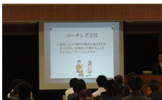
コーチングは部下の能力を引き出すスキル