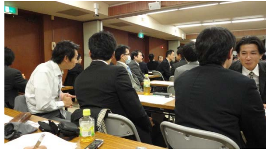
隣もしくは後ろの人とペアになって傾聴の練習